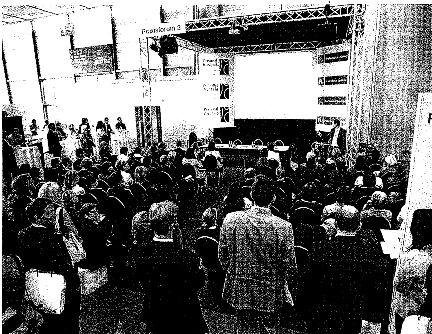
Stets gut frequentiert: die Stände der Aussteller (o.) und eines der Praxisforen (u.)