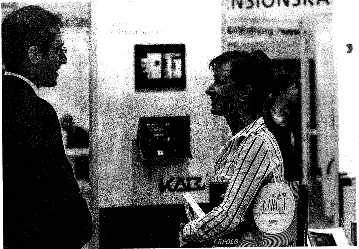
Die Besucher der Personal Austria und Professional Learning 2011 erwartet einmal mehr ein umfangreiches Messeprogramm.

Die zehnte Ausgabe der Personal Austria in Wien soll zeigen, wie Unternehmen mithilfe von zukunftsgerichteter Personalarbeit reüssieren können.