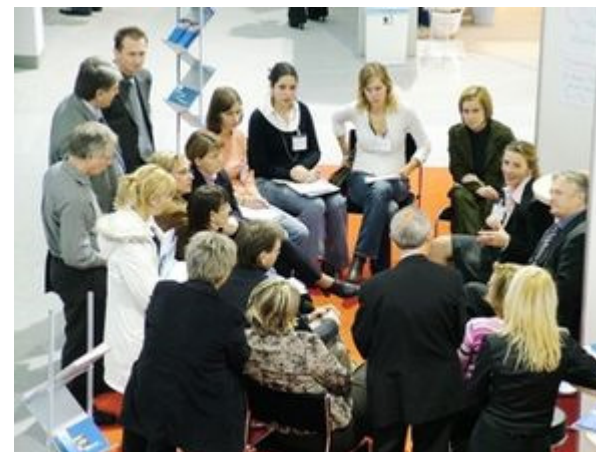
Austausch: Fachmesse in Wien will informieren